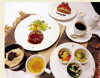
ディナーセット 3,000円

マクロビオティックの伝道師として、世界的にも有名な久司道夫氏の認定第1号店がこちら。オフィスビルの一角にありながら、心安らくアジアテイストの店内では、「人にやさしく、地球にうれしく」をベースに、玄米ご飯と有機野菜を中心とした食事をいただけます。野菜は実も皮も根も丸ごと使い、旬の食材を丁寧に調理したメニューを展開しています。砂糖、卵、乳製品、動物性食材、化学調味料は一切フリーでも、素材の味をしっかり引き出した滋味深い料理は、女性のみならず男性にも人気。また、オープン以来10年以上通い詰めるファンも多く、美容に精通した著名人にも好評とか。毎月第4土曜日の夜に催される「サタデーバイキング」は予約必須。フェイスブックでの情報発信も要チェックです。