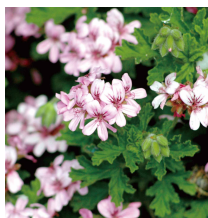
自社農園で有機栽培された数種類のハーブは、製品に配合されることも。

環境や安心への意識が高まるなか、地球の将来を考えたライフスタイルが注目され、食品をはじめ、化粧品にもオーガニックを取り入れる人が増えつつあります。太陽の恵みであるオーガニック植物をふんだんに使い、自然の恩恵を受けた「ヴィラロドラ」を作るケモン社では、地球環境を考え、持続可能な製品づくりをミッションとしています。