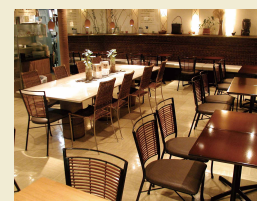
クシ・ガーデン デリ&カフェ

メイン料理(写真は雑穀ハンバーグ)、日替わりのデリ3品、玄米ご飯、スープもしくは味噌汁、デザート、ドリンクのセット。ノンカフェインコーヒーもあり。